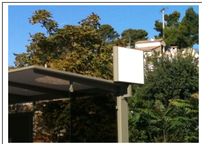
Modèle tête Elite