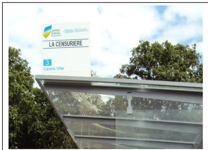
Modèle Tête économique

L'abri jade peut également être équipé d'un cadre horaires vissé sur le fond de l'abri (CF fiche technique cadre horaires) ou d'un caisson publicitaire à gauche, éclairé ou non éclairé (CF fiche technique caisson publicitaire).